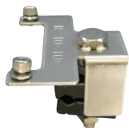
オプション 「D/SC」支持線取付金具