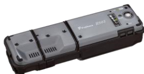
ファイバストリッパ RS03