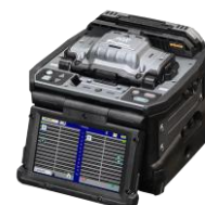
融着接続機 (*9) 90R