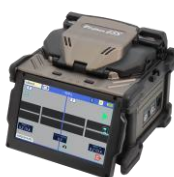
融着接続機 (*5) 45S