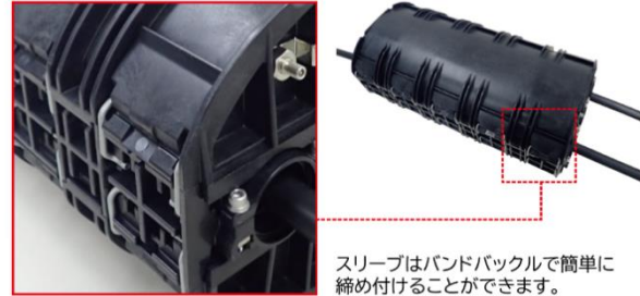
スリーブはバンドバックルで簡単に締め付けることができます。